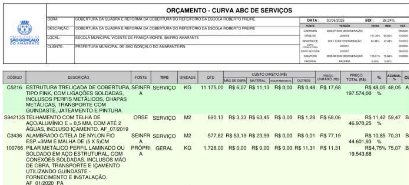
Imagem – Print Planilha Curva ABC – Itens de maior relevância Técnica – Art. 67, §1º

9.3.6. Para fins de comprovação que determinam os subitens 10.3.3 e 10.3.4 supracitados, os itens significativos de maior relevância do respectivo orçamento são: